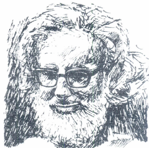
El poeta de Nicaragua Ernesto Cardenal (dibujo de Pedro Pérez)

Un público entusiasta y atento sostuvo posteriormente un debate político y poético con el poeta.