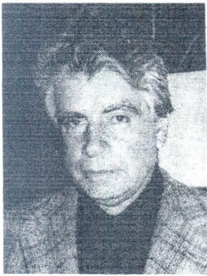
Dr. Leopoldo Zea