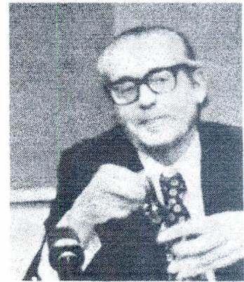
Dr. Adolfo Sánchez Vázquez

las ciencias físicas y en las disciplinas sociales e históricas, y 2. En los límites del conocimiento y el entendimiento científico. Durante esta semana el Dr. Hempel dictó tres conferencias en el salón 11 a saber: Lunes 12 de mayo: CIENCIA EMPIRICA Y CONOCIMIENTO A PRIORI: PROBLEMAS DE DEMARCAACION. Martes 13: MATERIALISMO, CONDUCTISMO Y FISCALISMO. PROBLEMAS DE REDUCCION. Miércoles 14: ASPECTOS SOCIOLOGICOS DE LA TEORIZACION CIENTIFICA: PROBLEMAS PARA UNA RECONSTRUCCION RACIONAL DE LA CIENCIA.