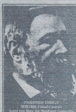
FRIEDRICH ENGELS 1820-1895 Filósofo alemán Autor con Marx del Manifiesto Comunista