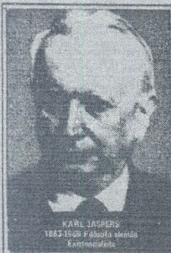
KARL JASPERS 1883-1969 Filósofo alemán Existencialista

AÑO III ■ NOVIEMBRE-DICIEMBRE DE 1977 ■ NUMERO 6