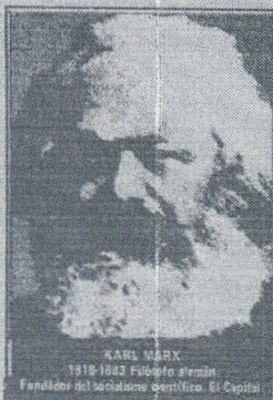
KARL MARX 1818-1883 Filósofo alemán Fundador del socialismo científico. El Capital