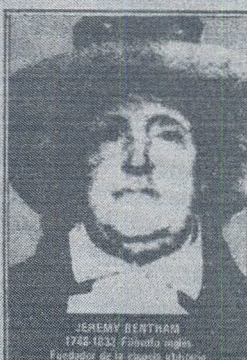
JEREMY BENTHAM 1748-1832 Filósofo inglés Fundador de la escuela utilitaria