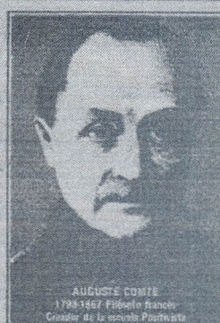
AUGUSTE COMTE 1789-1857 Filósofo francés Creador de la escuela Positivista