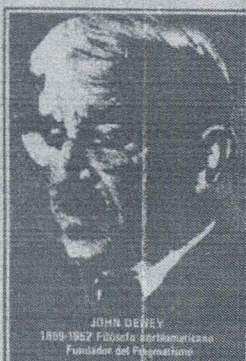
JOHN DEWEY 1859-1952 Filósofo estadounidense Fundador del Pragmatismo