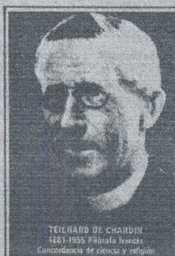
TEILHARD DE CHARDIN 1881-1955 Filósofo francés Concordancia de ciencia y religión