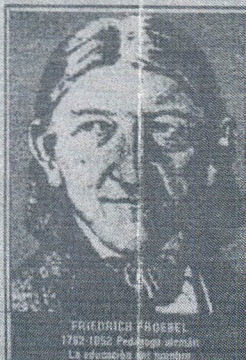
FRIEDRICH FROEBEL 1782-1852 Pedagogo alemán La educación del niño