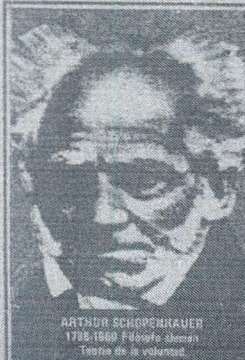
ARTHUR SCHOPENHAUER 1788-1860 Filósofo alemán Teoría de la voluntad