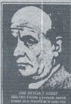
JOSE ORTEGA Y GASSET 1883-1955 Filósofo y ensayista español Creador de la filosofía de la razón vital