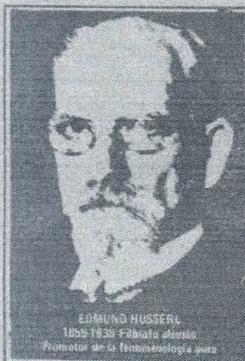
EDMUND HUSSERL 1889-1938 Filósofo alemán Promotor de la fenomenología pura