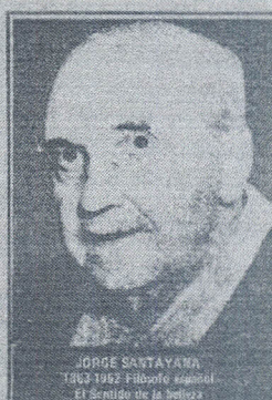
JOSÉ SANTAYANA 1863-1952 Filósofo español El Sentido de la belleza