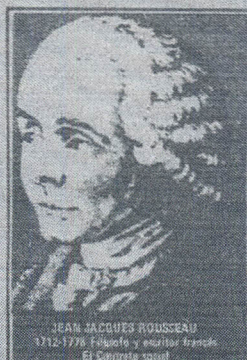
JEAN JACQUES ROUSSEAU 1712-1778 Filósofo y escritor francés El Contrato social