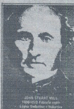
JOHN STUART MILL 1806-1873 Filósofo inglés Lógica Deductiva e Inductiva