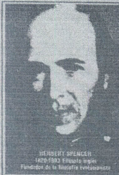
HERBERT SPENCER 1820-1903 Filósofo inglés Fundador de la filosofía evolucionista