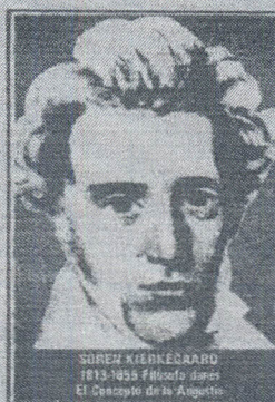
SØREN KIERKEGAARD 1813-1855 Filósofo danés El Concepto de la Angustia