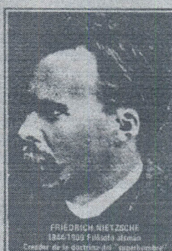
FRIEDRICH NIETZSCHE 1844-1900 Filósofo alemán Creador de la doctrina del "superhombre"