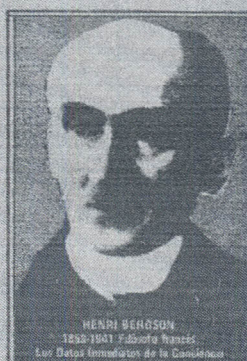
HENRI BERGSON 1859-1941 Filósofo francés Las Duras Inmutables de la Conciencia