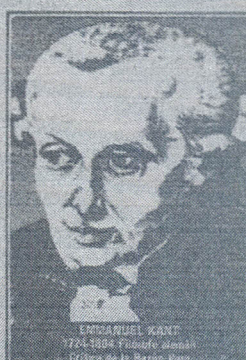
EMMANUEL KANT 1724-1804 Filósofo alemán Crítica de la Razón Pura